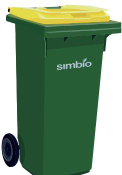
PLASTIČNA IN KOVINSKA EMBALAŽA

Z rumeno barvo je označen teden, ko se v vaši občini odvažajo odpadna embalaža (embalaža se odvažajo izmenično z mešanimi odpadki, na isti dan kot do sedaj).